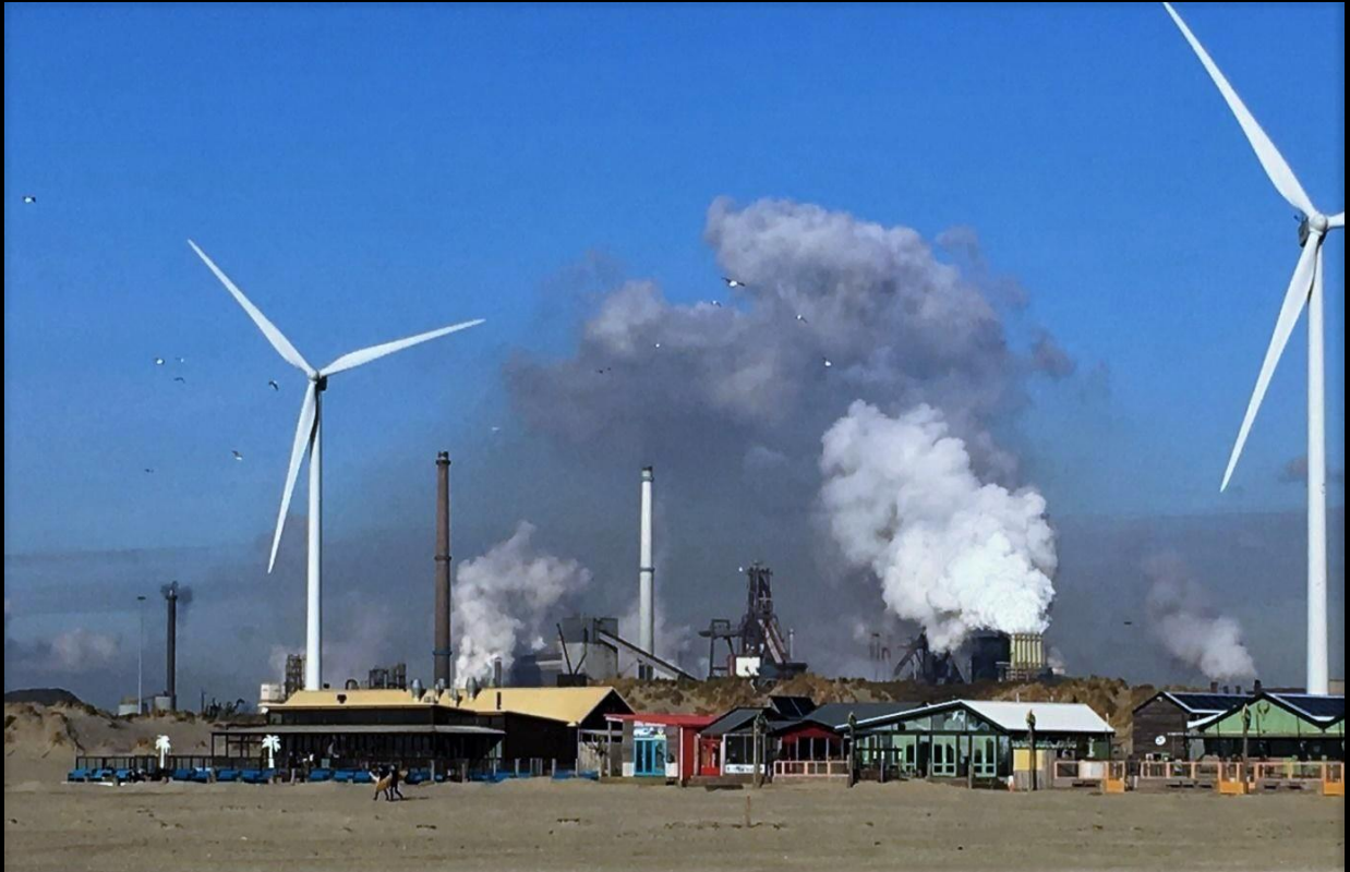
Gewone dag, vanaf het strand gezien, dagelijks