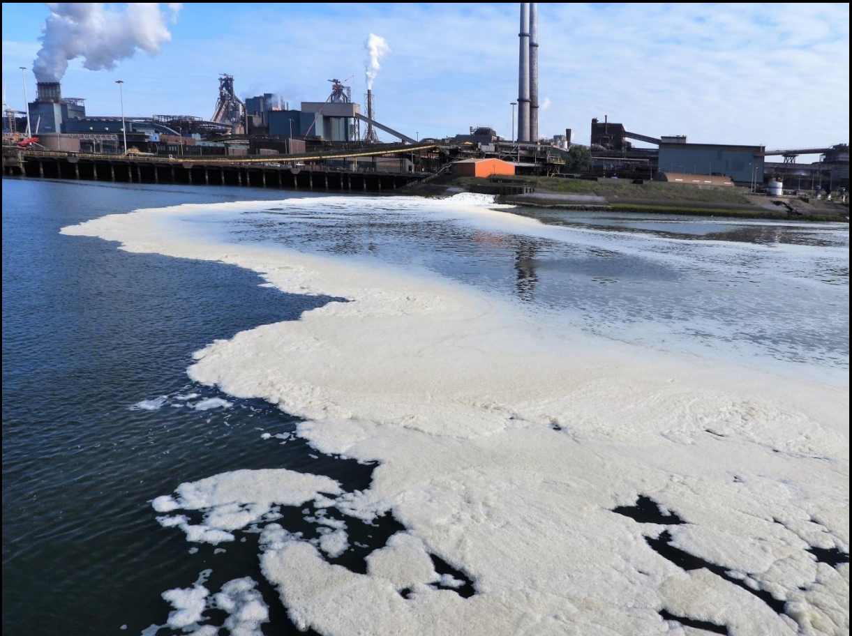
Lozing van afvalwater, in de open verbinding naar zee. Dagelijks.

Naast 100.000 kg ijzer jaarlijks ook nog oa: Cadmium, Chroom3 en Chroom6, Cyanide, koper, kwik, lood, zink, fosfor enz. Zelfs nog 500.000kg Stikstof (cijfers TATA)