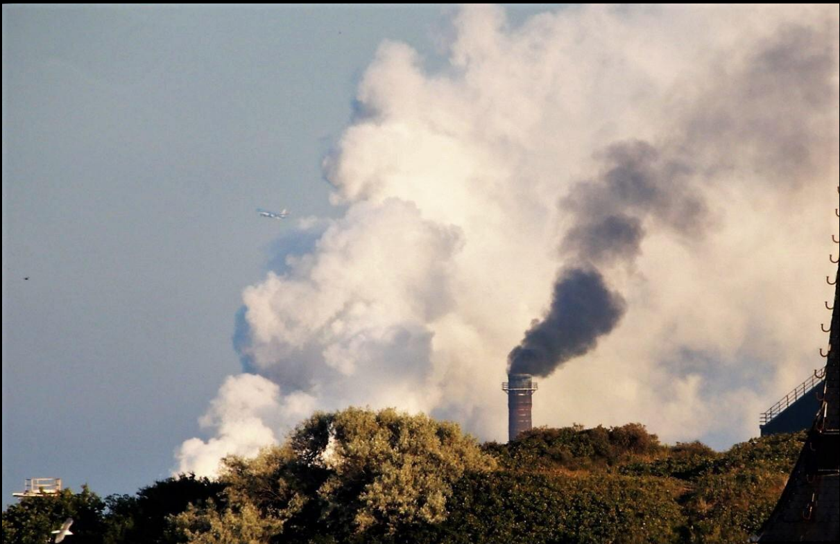
Zo nu en dan wordt er weer een oven opgestookt, hier de warmband walserij Gewone dag, veel voorkomende pieklast. Pieklast valt buiten de vergunning.