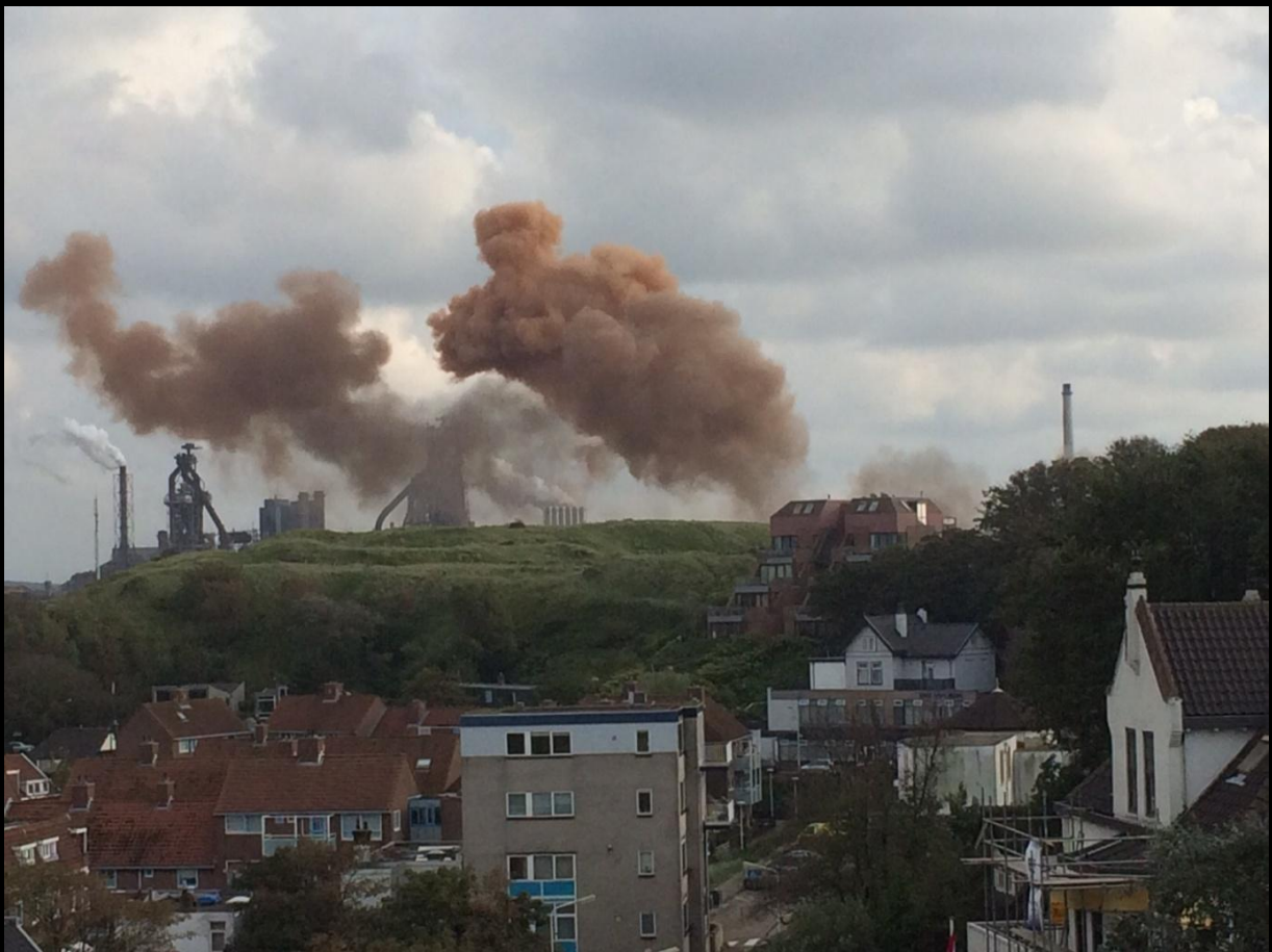
Stofverwaaiing van het kiepen van slakpannen.