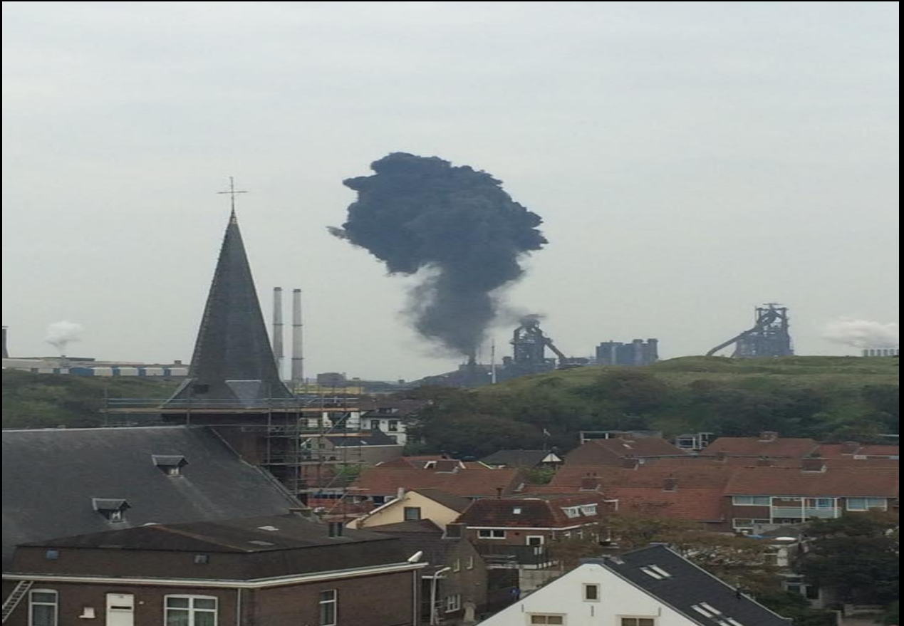
Nog een probleem bij Hoogoven 6