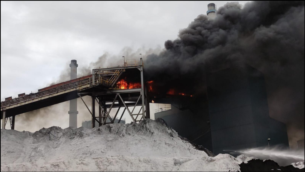
Een brand in het transport systeem, waarbij bewoners niet gewaarschuwd zijn.