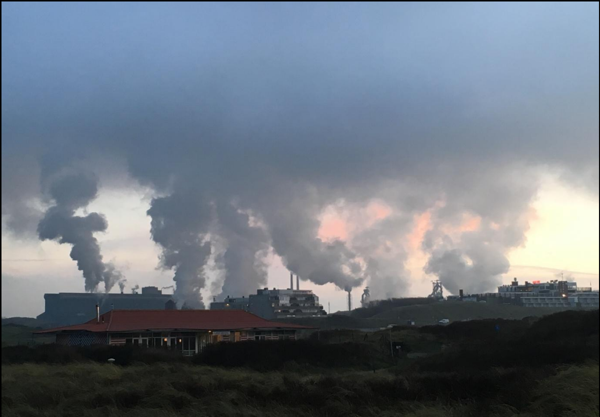
Dagelijks, het blijkbaar normaal.